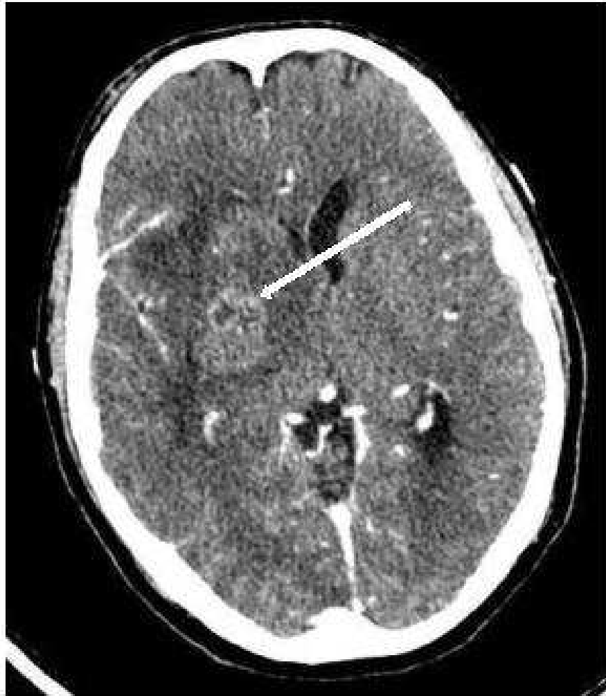
Figure 1 : coupe axiale sans injection de produit de contraste