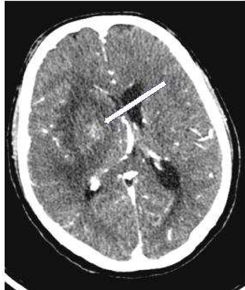
Figure 2 : coupe axiale avec injection de produit de contraste