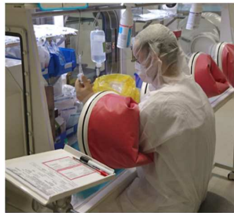
Fabrication en isolateur stérile