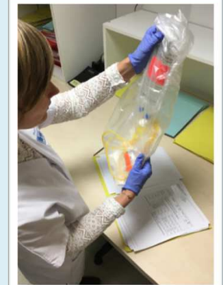
Contrôle des préparations

Contrôle final unitaire de votre traitement